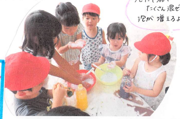
泥で器で たくさん混ぜると 泥が増えるよ～