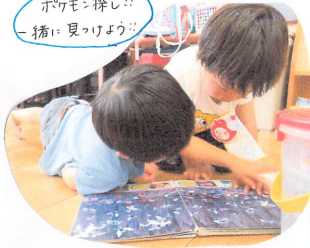
ポケモン探し!! 一緒に見つけよう!!

4日間という短い期間ではありましたが、夏ならではのあそびを十分に 行えるように、という思いで環境を作りました😊 色水づくり、泥づくり、スライム作りにおいては、最初は“～して良いの?”と 確認をしておこなっていることが多くありました。そこで、“ こうしてみたい ” “ やってみよう ”という 思い を 形 にできるように、子どもたち自身で扱える ような物を置いておくことで、まずは やってみよう !!ということができるように なりました。色づくりや泥づくり、 自分の理想 としているものになるよう、 色を混ぜたり、水の調整をしてみたり...と、実際には、やってみることでの 発見 それぞれにあつてはようです。 「今日は泥に色を付けてみよう!!」など、毎日 目的 を持ってあそんだり、 興味 を深めようと日々、考えながら過ごせるように思います。