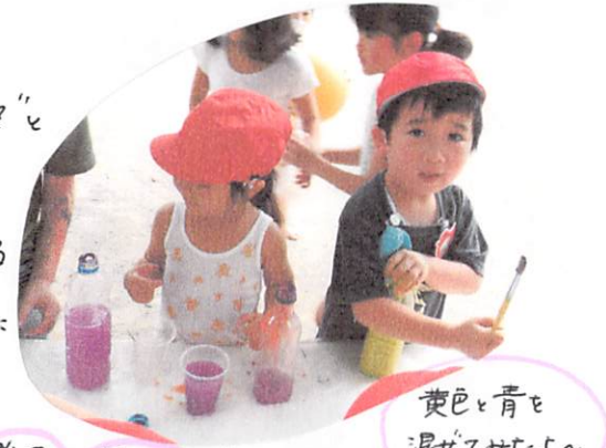
黄色と青を 混ぜてみよう

4日間という短い期間ではありましたが、夏ならではのあそびを十分に 行えるように、という思いで環境を作りました😊 色水づくり、泥づくり、スライム作りにおいては、最初は“～して良いの?”と 確認をしておこなっていることが多くありました。そこで、“ こうしてみたい ” “ やってみよう ”という 思い を 形 にできるように、子どもたち自身で扱える ような物を置いておくことで、まずは やってみよう !!ということができるように なりました。色づくりや泥づくり、 自分の理想 としているものになるよう、 色を混ぜたり、水の調整をしてみたり...と、実際には、やってみることでの 発見 それぞれにあつてはようです。 「今日は泥に色を付けてみよう!!」など、毎日 目的 を持ってあそんだり、 興味 を深めようと日々、考えながら過ごせるように思います。