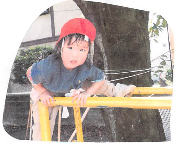
うんていの上も のぼれるんだ!!