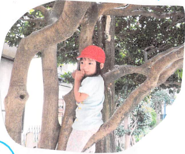
ここが 落ち着くのや