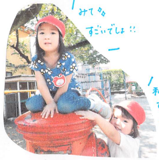
みてや すごいでしょ!!