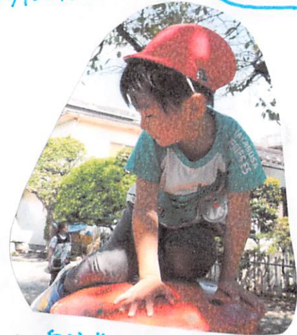
もっと 上にのぼりたいや!!